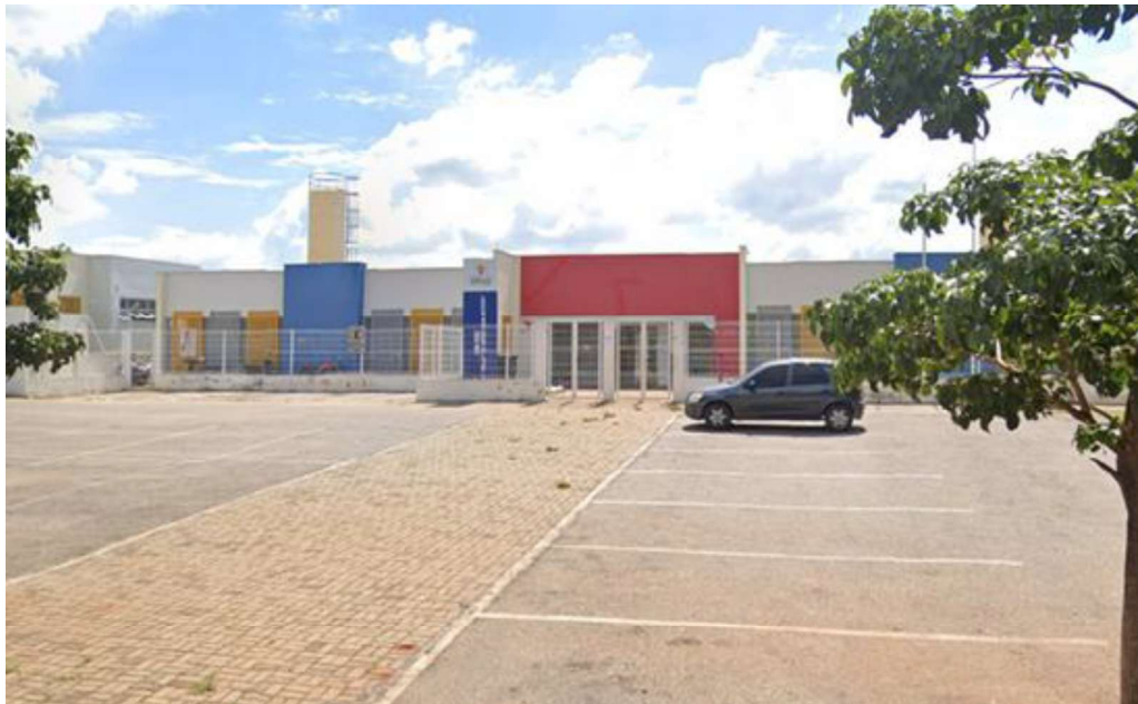
Imagem capturada em abril de 2023

O Residencial Carandá também conta com duas escolas que atendem às etapas da pré-escola e ensino fundamental: a E.M. Renice Seraphim — uma das maiores do município — e a E.M. João Batista Larizatti Junior. Assim, é possível afirmar que o local é bem assistido em termos de equipamentos educacionais.